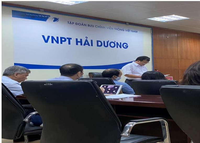
Đ/c Nguyễn Minh Hùng – Phó Chủ tịch UBND tỉnh phát biểu tại điểm cầu Hải Dương

USD; vốn đầu tư FDI đạt trên 1 tỷ USD với 41 dự án; tỷ lệ giải ngân vốn đầu tư công đạt gần 42%... Về một số chỉ tiêu chủ yếu phát triển kinh tế - xã hội năm 2022, Vùng Đồng bằng sông Hồng phần đầu tốc độ tăng GRDP 7,9%, thu ngân sách nhà nước đạt trên 518.000 tỷ đồng, tổng vốn đầu tư phát triển toàn xã hội 1,2 triệu tỷ đồng. Vùng Trung du, miền núi phía Bắc phần đầu tốc độ tăng GRDP 8%, thu ngân sách nhà nước đạt trên 68.000 tỷ đồng, tổng mức đầu tư toàn xã hội trên 338.000 tỷ đồng.